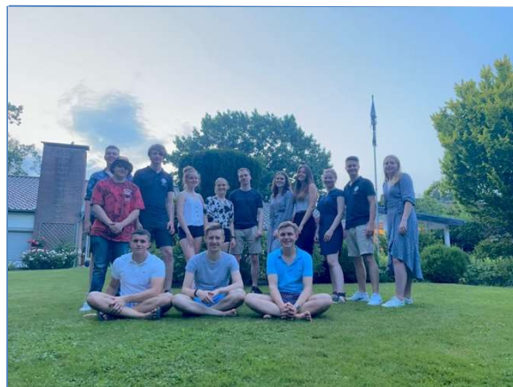
Ämterübergabe 20/21 zu 21/22 v. 18.06.2021