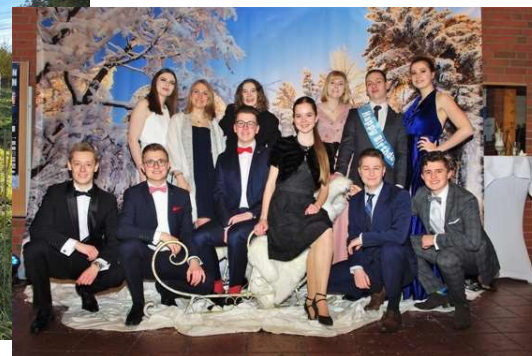
Lionsball Henstedt-Ulzburg v. 15.02.2020